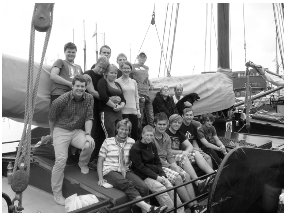
Pappenheimer auf hoher See – die Crew auf ihrem Segelboot vor dem Auslaufen

Bei der Abschlussandacht in der Autobahnkirche Medenbach konnten wir dankbar auf die schönen Tage zurückblicken. Es war nicht die letzte Freizeit dieser Crew, das ist sicher. (fs)